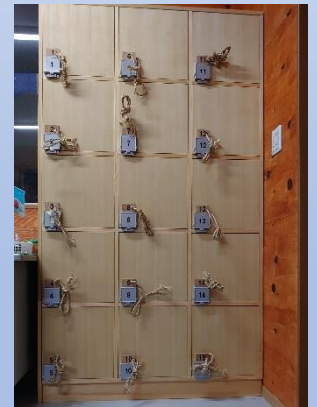
親子用いちご型流し台。

これまでご不便をかけたトイレはおむつ交換台付きバリアフリートイレと男女別・温水洗浄便座付きの水洗式になりました。