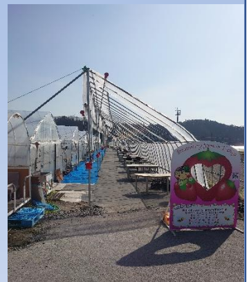
職員手作りの特製ビニールハウス+ラウンジ